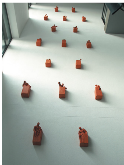
Helmië Brugman, Keramische installatie Grown Out , 2010; terracotta; oppervlakte 650 x 300 cm; beelden 13 x 13 x 28 cm elk. Opdrachtgever Peter van den Berg.

Dat is ook heel duidelijk zichtbaar in wat Helmië gedaan heeft tijdens een werkperiode bij sundaymorning@ekwc dit jaar. In eerste instantie richtte zij zich op materiaalonderzoek. Zo drukte ze piepschuimballetjes in de porselein; dat resulteerde in een prachtig, kwetsbaar portretje. Later ontstond de grote beeldengroep The Terracotta Davids . Een leger lagere schooljongetjes, net iets kleiner dan ware grootte, ieder afzonderlijk staand op een eenvoudige palletachtige houten sokkel. Een opstelling als bij een opgraving. Bij elk beeld zijn er sporen of attributen uit het maakproces te zien. Pakken klei, een constructie van planken, schuimrubber kussens, lappen waarmee het beeld aan de plank gebonden is, het ontbreken van één of beide armen (die er later aan gemonteerd werden), maar ook de gipsen mallen, spanbanden en papieren sjablonen spelen een rol. De titel verwijst zowel naar het Chinese terracotta leger als naar de meer dan levensgrote David van Michelangelo. Helmië koos bewust voor een kind, een etalagepopje, omdat etalagepoppen net als het klassieke beeld van Michelangelo een ideaalbeeld vertegenwoordigen. Het beeldje is geslachtsloos, onschuldig, onbevangen en in zekere zin nog onbeschadigd. Net als kleine verschillen bij de geboorte al bepalen hoe men later met je omgaat, bepalen subtiele vervormingen bij het uit de mal halen, hoe Brugman verder werkt