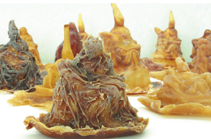
Helmie Brugman, Vorm+Vervorm (installation view), 2007; latex; 30 x 200 x 100 cm.