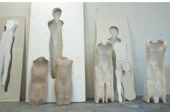
Helmie Brugman, Installation View , 2013; mixed media (multiplex, karton, keramiek, gips); 300 x 400 x 25 cm.