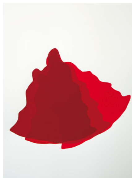
Helmië Brugman, Ring the bells , 2008; zeefdruk, oplage 3; 120 x 100 cm. Dit werk bestaat uit drie delen, waarvan alleen het laatste deel is afgebeeld.

• Helmië Brugman, Keramische installatie Grown Out . Verzamelkantoorgebouw, Beukenlaan 125-129 (tegenover het Evoluon), NL-5616 VD Eindhoven. Tijdens kantooruren te bezichtigen: maandag t/m vrijdag 9.00-16.00 uur. Info: www.helmiëbrugman.nl