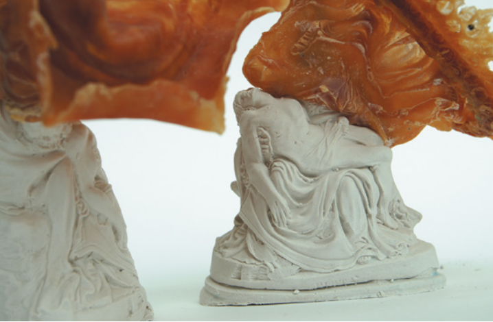
Helmie Brugman, Leave me (detail), 2006; gips, latex; totaal 40 x 75 x 50 cm.